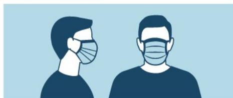
VEJA O USO CORRETO DA MÁSCARA