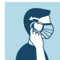
COLOQUE O ELÁSTICO OU TIRAS DE FIXAÇÃO ATRÁS DA CABEÇA OU SOBRE AS ORELHAS