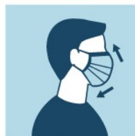
AJUSTE COBRINDO O NARIZ E O QUEIXO. NÃO DEIXE ESPAÇOS ENTRE SEU ROSTO E A MÁSCARA