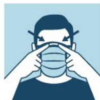
PRESSIONE A TIRA METÁLICA PARA AJUSTAR AO CONTO RNO DO NARIZ