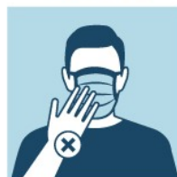
NÃO TOQUE A MÁSCARA. SE TIVER QUE TOCAR, LAVE AS MÃOS ANTES E DEPOIS