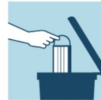
DESCARTE A MÁSCARA EM LIXO FECHADO, SEM TOCAR NA PARTE FRONTAL