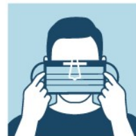
LOCALIZE A TIRA METÁLICA E A POSICIONE SOBRE O NARIZ