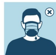
TROQUE A MÁSCARA SE ELA FICAR ÚMIDA. EVITE REAPROVEITAR OU SIGA AS ORIENTAÇÕES DO MINISTÉRIO DA SAÚDE